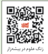
زنگ علوم در پیشه‌زار