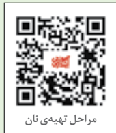
مراحل تهیه نان

فصل یازدهم بسیار اهمیت دارد، زیرا به مراحل رشد خود کودک اشاره می‌کند و نکته‌های با اهمیتی را به دانش‌آموز یاد می‌دهد؛ از نگهداری دندان‌ها تا مراقبت از سلامتی کودک.