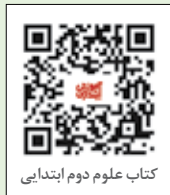
کتاب علوم دوم ابتدایی